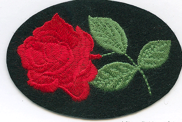
刺しゅうサンプル